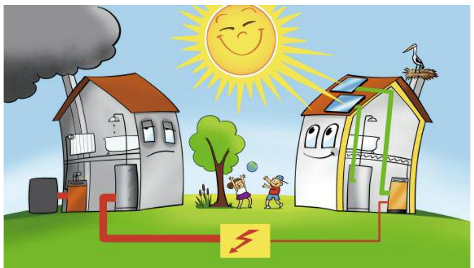
Die beiden Häuser könnten unterschiedlicher nicht sein: Mit erneuerbarer Energie lebt es sich besser.