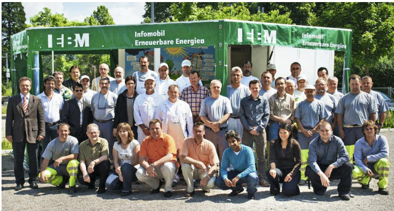
Wir sind für Sie da: das Team der EBM Ecotec AG.

Die EBM Ecotec AG erleichtert die Investition in nachhaltige Energieprodukte dank einem guten Preis-Leistungs-Verhältnis, professionellen Service- und Dienstleistungen sowie überdurchschnittlichen Garantieleistungen.