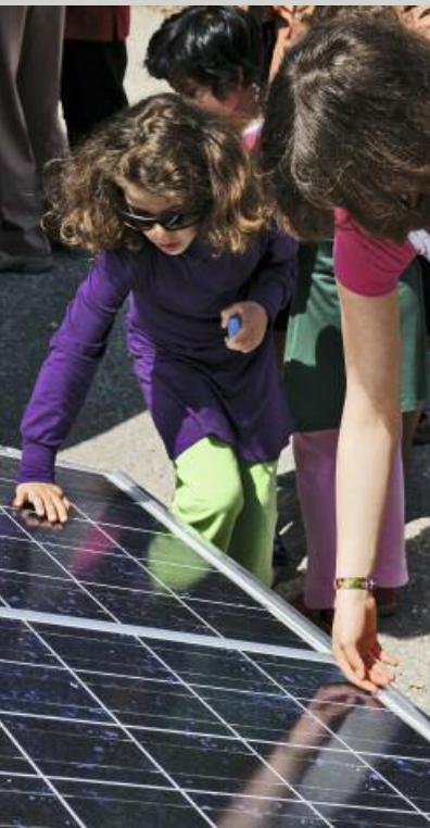
Nachhaltigkeit zum Anfassen.

Die EBM Ecotec AG kennt sich in der komplexen Materie bestens aus: sei es bei der Planung, der Ausführung oder beim Einreichen der Gesuche für Förderbeiträge. Bauen Sie auf unsere langjährige Erfahrung und profitieren Sie von unseren aussergewöhnlichen Service- und Dienstleistungen.